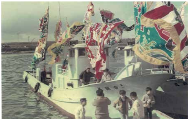
会社の前身である漁師時代 第一合同丸 進水式 昭和47年2月20日