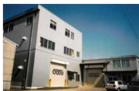
1990年 本社工場を 春日町へ移転し、工場拡大