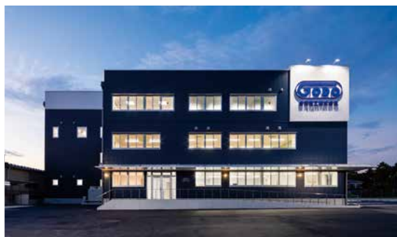
2019年六軒町に新本社・工場完成 現在では5軸制御立形マシニングセンタや複合NC旋盤など お客様のニーズに応えられる設備を整えております