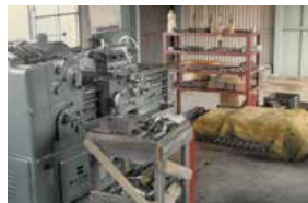
創業時、宮町本社工場へ 導入したワシノ機械