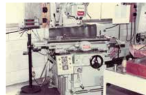
宮町工場内の貴重な写真